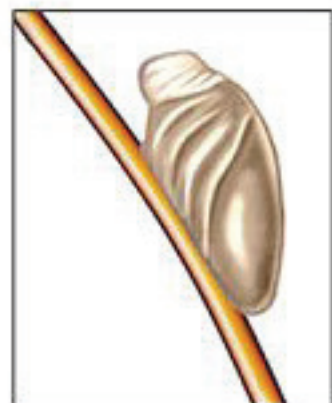
Яйцо вши (гнида) на волосе